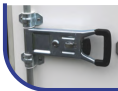
Doppelflügeltür hinten mit Drehstangenverschluss