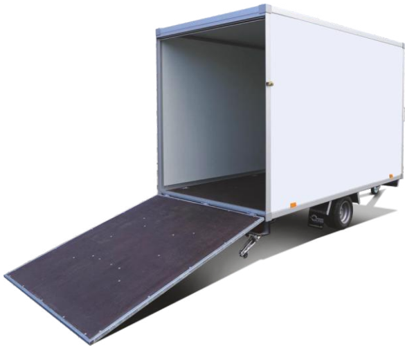
Auffahrklappe – leichte Handhabung, durch Gasdruckdämpfer unterstützt